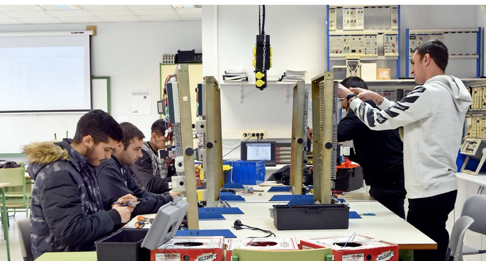
Clase de Electrotecnia.