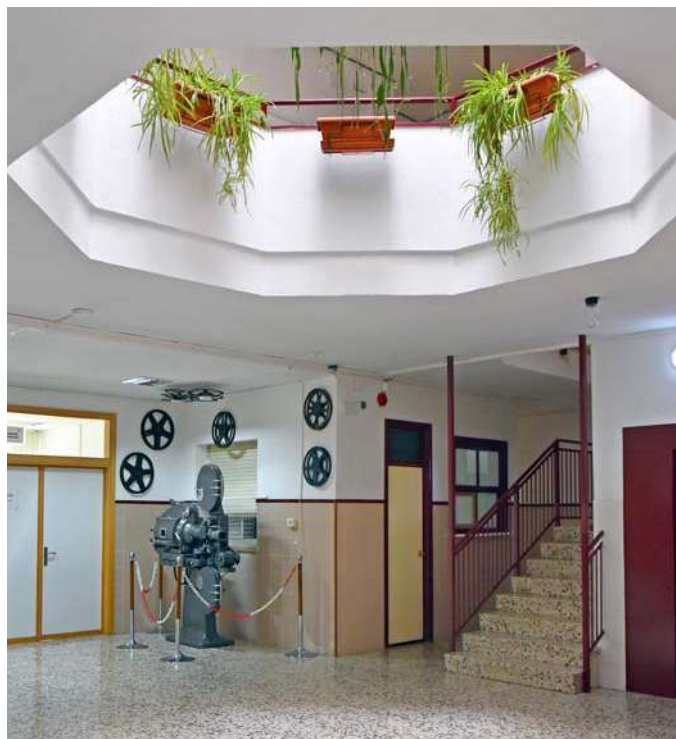
Espacio del edificio principal con el antiguo proyector de cine del salón de actos al fondo.

Con la dirección del centro se solicitan subvenciones que se han de realizar a través del AMPA y se forma parte del Consejo Escolar con dos representantes. La sede de la asociación está en el edificio A y atendemos al público los lunes de 10:30 a 12 horas y de 17 a 18:30 horas.