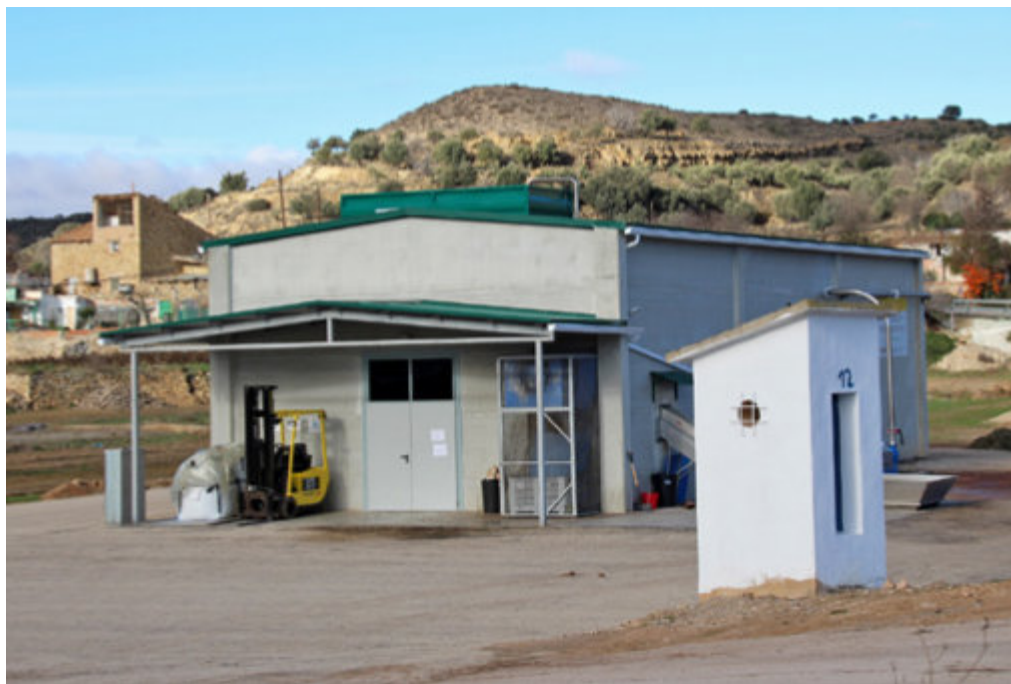
Parte exterior de la almazara

A finales de noviembre del 2016 se inauguró en Oliete una moderna almazara impulsada por el proyecto apadrinaunolivo.org con el objetivo de complementar y dar continuidad a su proyecto de recuperación de olivos yermos emprendido hace unos años.