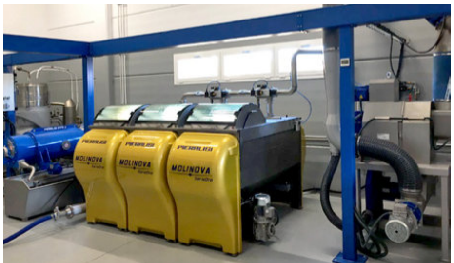
Instalaciones de la almazara