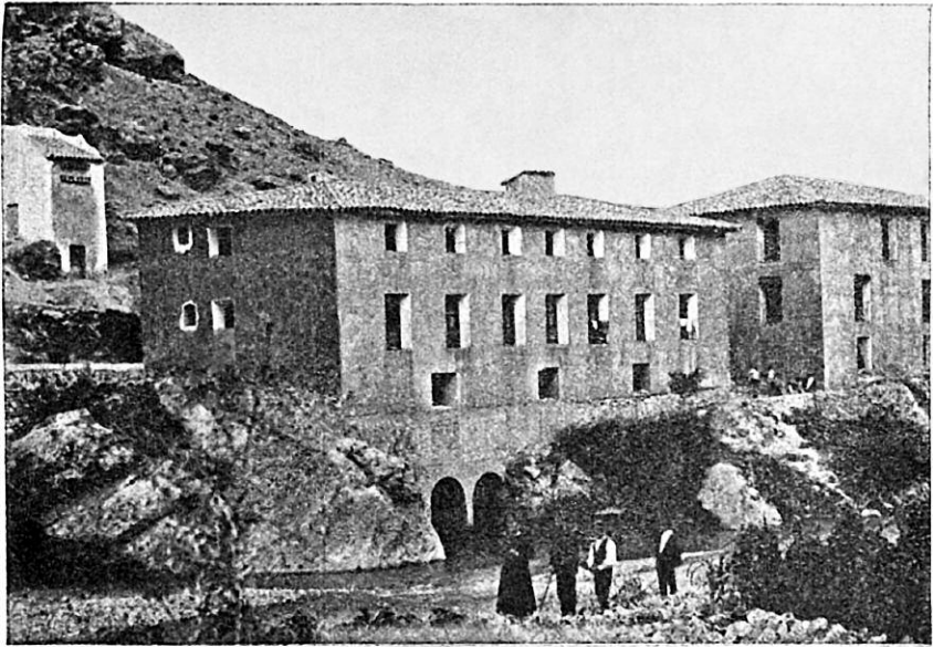
Fonda de los baños de Ariño (Teruel).