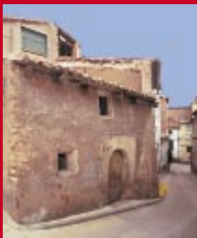
Calles de Esteruel

Son 33 las delimitaciones comarcales de Aragón. En la actualidad 32 comarcas están ya constituidas, sólo queda por constituirse la comarca de Zaragoza. Cada comarca tiene su propia ley de creación, en la que se establece su denominación, capitalidad, competencias, organización, régimen de funcionamiento, personal y hacienda comarcal.