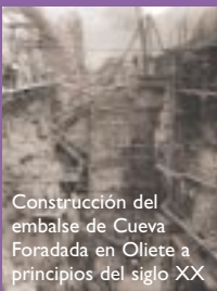
Construcción del embalse de Cueva Foradada en Oliete a principios del siglo XX.