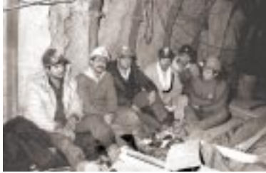
Encierro de mineros en una mina de Esteruel en 1981

A la muerte del general Franco, el nombramiento de Adolfo Suárez como jefe de gobierno suscitó algunos recelos y no poco desaliento en la España expectante del momento; sin embargo, con un gabinete joven, de políticos no muy relevantes, inició un proceso de cambios que habrían de poner fin a la dictadura franquista y desembocar en la democracia. El 15 de diciembre de 1976 se celebró un referéndum, convocado por el gobierno, sobre la Ley para la Participación Política, bajo el eslogan Habla Pueblo. Para que nadie decida por ti . A pesar de que la oposición democrática se pronunció por la abstención, el resultado fue contundente: un 77% de síes frente a un raquítico 2,6% de noes. El primer paso estaba dado. Después vendrían las elecciones de 1977 a Cortes constituyentes y la aprobación, nuevamente en referéndum, de la Constitución de 1978, principal instrumento político para la edificación de la nueva democracia española.