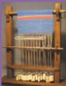
Recreación de un telar ibérico y muestras de sus pesos ( pondus )

Recreaciones de un molino de mano y de un arado ibéricos