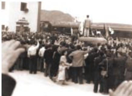
El público recibe con el saludo fascista el tren en el que viajaba Franco cuando hizo su visita a Andorra en 1953.

La victoria del general Franco en la Guerra Civil dio paso a un nuevo orden de carácter fascista, que se inició con una dura represión de los vencidos. Fusilamientos por Consejo de Guerra, encarcelamientos de los acusados de colaboración con el régimen anterior, aplicación de la Ley de Fugas, campos de concentración y aplicación de la Ley de Responsabilidades políticas, que permitía apartar de los cargos públicos a todos los que eran sospechosos de disidencia respecto al nuevo orden y reemplazarlos por personas afines al partido único: Falange Española Tradicionalista y de las JONS. En la administración local se apartó del cargo a los alcaldes electos y