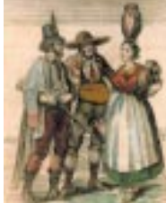
Tipos del Bajo Aragón