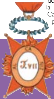
Medalla concedida por Fernando VII, tras la Guerra de Independencia, a los combatientes de la batalla de Alcañiz.