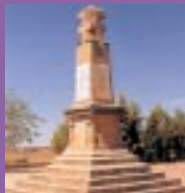
Monumento en el santuario de Pueyos a la batalla de Alcañiz

En 1613 Felipe III concede la independencia respecto de Albalate del Arzobispo a las localidades de Andorra, Ariño y Arcos.