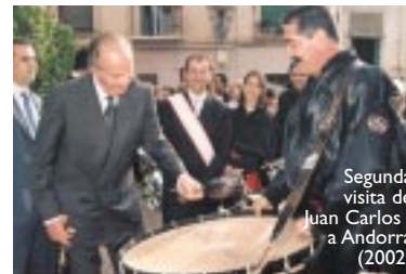
Segunda visita de Juan Carlos I a Andorra (2002)

Las posibilidades de participación política se han ido incrementando en la misma medida que se han ido acercando a los ciudadanos los órganos de decisión política: primero fue la constitución de la autonomía aragonesa a partir del Estatuto de 1982; después la comarcalización de Aragón, que dio origen a nuestra comarca. La democracia permite intervenir a los ciudadanos en los asuntos públicos y controlar la gestión de los gobernantes en las distintas escalas de la administración para mejorar las condiciones de vida y las relaciones sociales, empezando por las de nuestro entorno más cercano. Por eso, es una obligación de responsabilidad cívica procurar individual y colectivamente una democracia activa, participativa y solidaria.