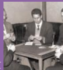
Los juegos de cartas en el café representan mejor que nada el tedio de la vida social franquista.

Cartillas de racionamiento y carnés sindicales, dos signos del ordenancismo y control franquistas.