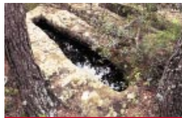
Tumbas antropomorfas medievales de La Codoñera

A partir del siglo V las tierras que pertenecían en su mayoría a terratenientes romanos fueron objeto de una ocupación o conquista esporádica por parte de los visigodos. Su presencia real en la zona fue