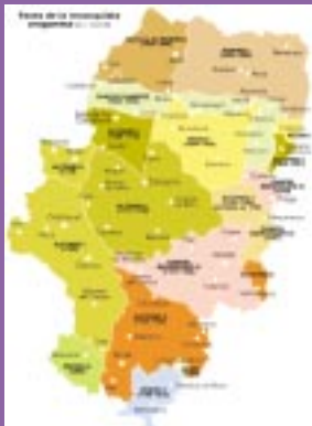
Mapa de las fases de la conquista del territorio musulmán por el reino cristiano de Aragón (siglos XI-XII)