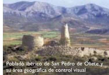
Poblado ibérico de San Pedro de Oliete y su área geográfica de control visual