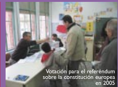
Votación para el referéndum sobre la constitución europea en 2005

Son instituciones de la Comunidad Autónoma las Cortes de Aragón, el Presidente, la Diputación General y el Justicia de Aragón.