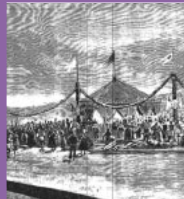
Inauguración de la línea de Val de Zafán por Alfonso XII

El bipartidismo existente a escala nacional (partidos Conservador y Liberal) se concretó en el caso de Andorra en dos grupos sociales y políticos con intereses opuestos: labradores (familias de propietarios agrarios) y jaboneros (comerciantes y fabricantes, que recibieron este nombre por ser la fabricación de jabón su actividad fundamental). Como ocurría a escala nacional, ambos partidos se alternaron de mutuo acuerdo en el desempeño del poder municipal y estaban controlados por los "caciques" locales, como el conservador Gabriel Aranda en Alloza. En las elecciones al Parlamento la provincia estuvo controlada por el Partido Conservador y la figura principal fue Rafael Andrade. La mayoría de los candidatos "elegidos" fueron siempre "cuneros", es decir, políticos foráneos, que eran impuestos por los partidos desde Madrid.