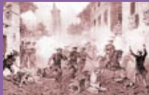
Los zaragozanos rechazaron el 5 de marzo de 1835 al ejército carlista. En memoria de esta hazaña ciudadana se celebra en Zaragoza la Cincomarzada .