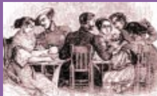
El general carlista Cabrera, después de entrar en Alloza, celebró un convite al que obligó a asistir a las más guapas del pueblo.