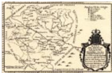
Mapa de los corregimientos de Aragón en el siglo XVIII