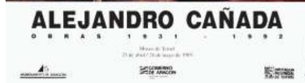
Exposición Museo de Teruel, 23 de abril de 1995.