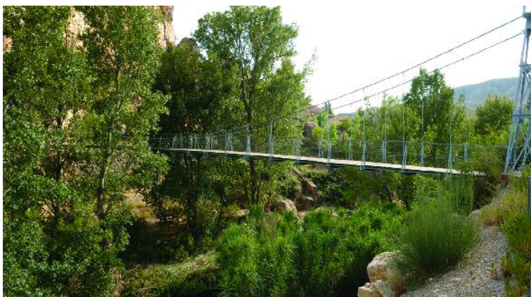
Puente colgante y álamos blancos (Ariño)

Este espectacular trío de pinos piñoneros ( Pinus pinea ) supone en su conjunto unos árboles singulares dignos de conocer de