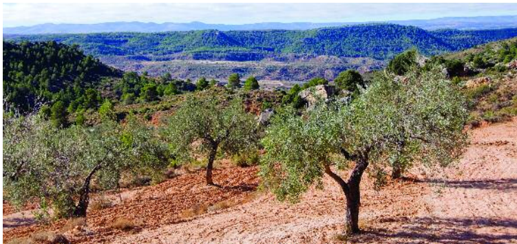
Vista desde las Cinglas (Alloza)