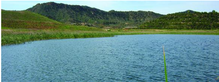
Humedal Corta Alloza en la Val de Ariño (Alloza)

Nos encontramos en un entorno claramente transformado por el hombre desde hace siglos; ante un paisaje típicamente mediterráneo, resultado de la interacción entre hombre y natura-