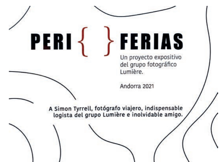
Dedicatoria a Simon Tyrrell del grupo Lumière.

Javier Alquézar Medina enfoca la periferia desde una dimensión temporal y fotografía la periferia del tiempo pasado, los vestigios del tiempo.