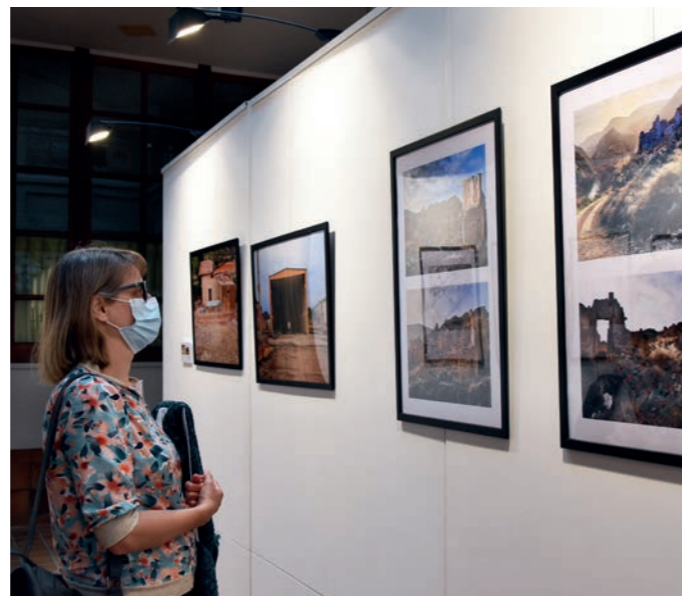
Tras la inauguración, los asistentes pudieron disfrutar de la exposición.