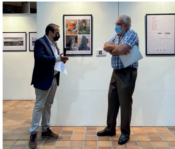
El alcalde de Andorra, Antonio Amador, inauguró la muestra fotográfica.