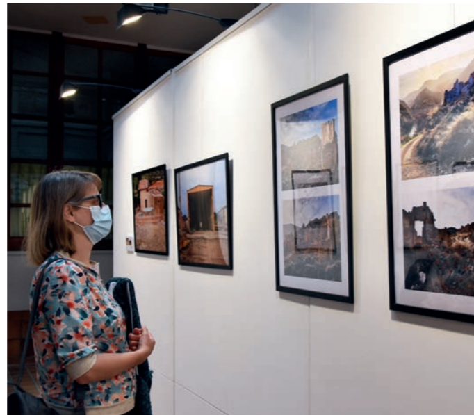
Tras la inauguración, los asistentes pudieron disfrutar de la exposición.