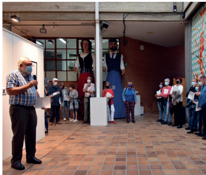
El presidente del Celan durante su presentación de Periferias .