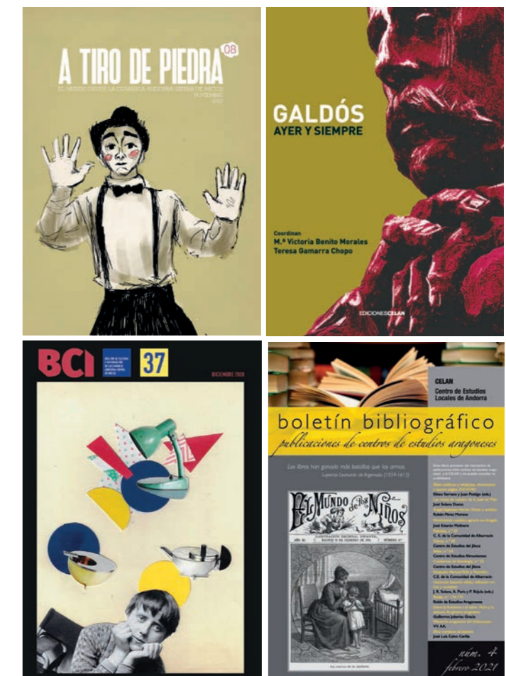
Portadas de las publicaciones del CELAN, a cuyos contenidos se puede acceder desde la página web celandigital.com

El Moncayo y el Beirut visitado hace un tiempo y el que tiene que seguir vivo abrieron nuestro objetivo, junto con el extravía a India. La sección Foto con letra y propuestas bibliográficas completan este número, con las últimas publicaciones del CELAN.