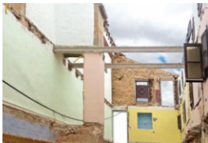
Trabajos en los muros y vaciado del edificio para su restauración.