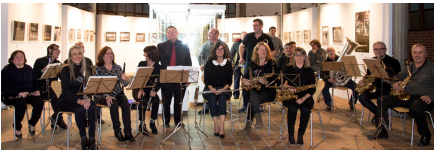
Posando para la posteridad tras el concierto que antiguos miembros de la banda dieron el día de Santa Cecilia.