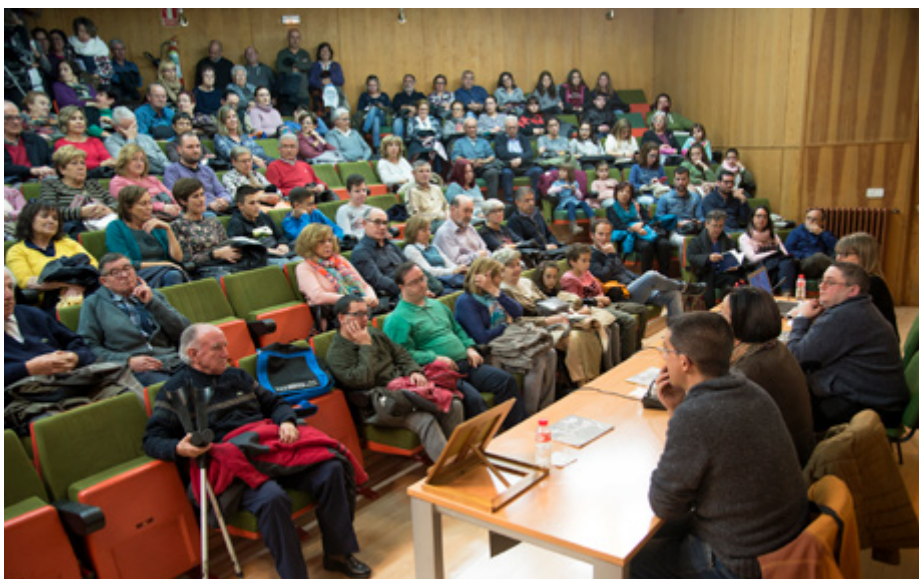
Gran asistencia de público durante los actos celebrados el día de Santa Cecilia.

Terminada la presentación, se levantó el mural de la Casa de Cultura y disfrutamos de una actuación musical especial. Algunos que habían sido componentes de la Banda de Música de Andorra no habían vuelto a tocar, así que además de los ensayos nos consta que “metieron horas extras” para conseguir este pequeño concierto, delicioso, bien