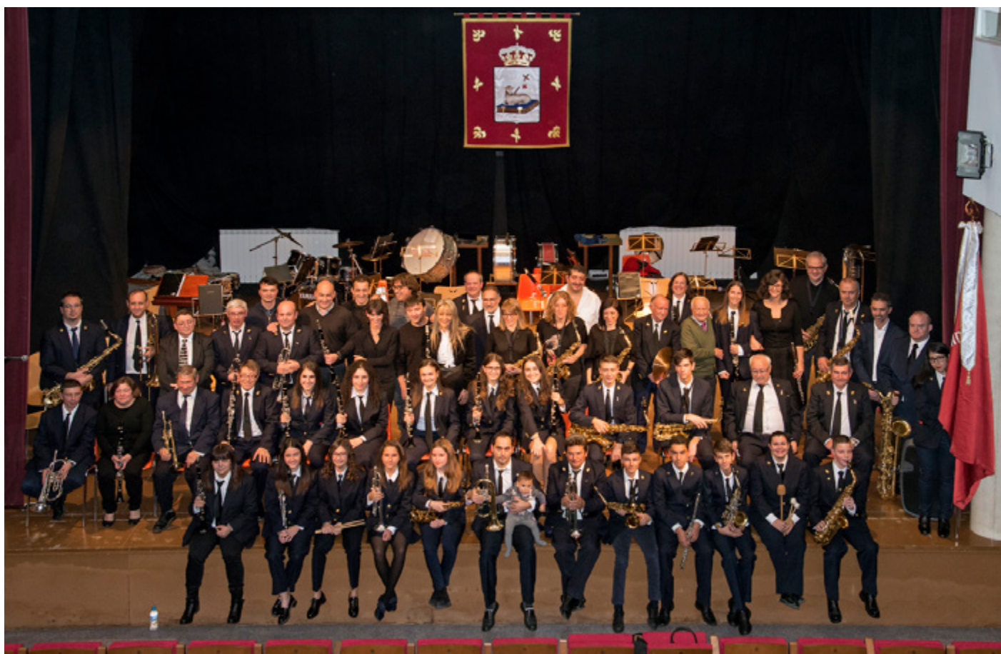
Foto de grupo tras el concierto de todos los músicos participantes en el concierto de Santa Cecilia 2017.

La banda es un complemento de otros actos y pasa desapercibida, es como el telón de fondo de un paisaje, presente en casi todas las actividades festivas y religiosas, dándoles prestancia, pero sin ser la protagonista. En esta ocasión sí lo ha sido, de forma bien merecida.