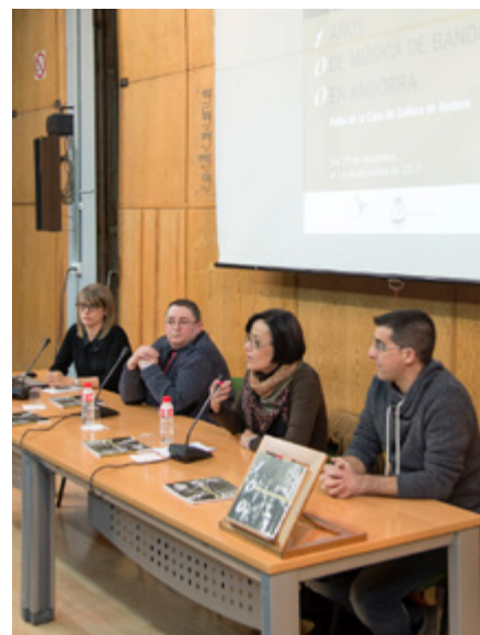
Participantes en la presentación de los actos del día de Santa Cecilia.