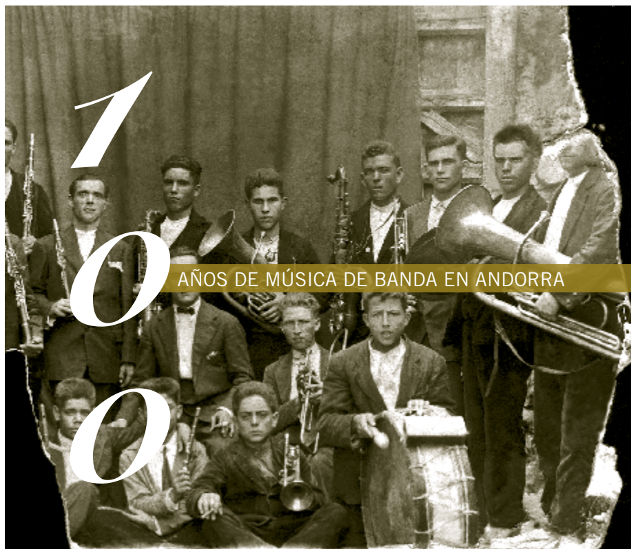
Portada de la publicación editada por el CELAN y el ayuntamiento para conmemorar el centenario de la Banda Municipal de Andorra.