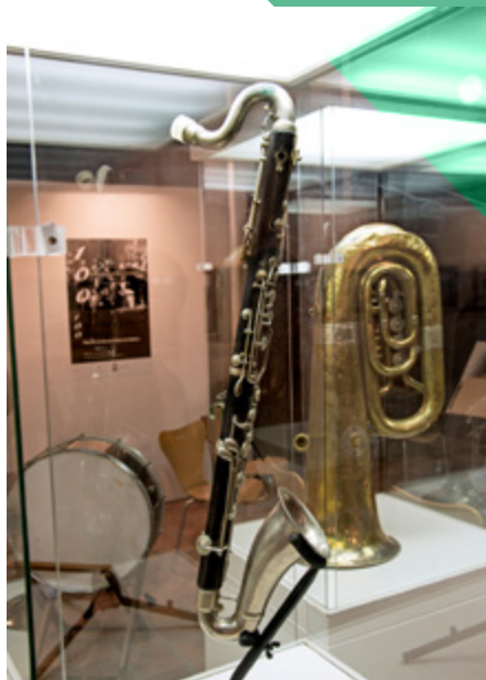
Clarinete bajo y tuba, algunos de los instrumentos que forman parte de la exposición 100 años de música de banda en Andorra.