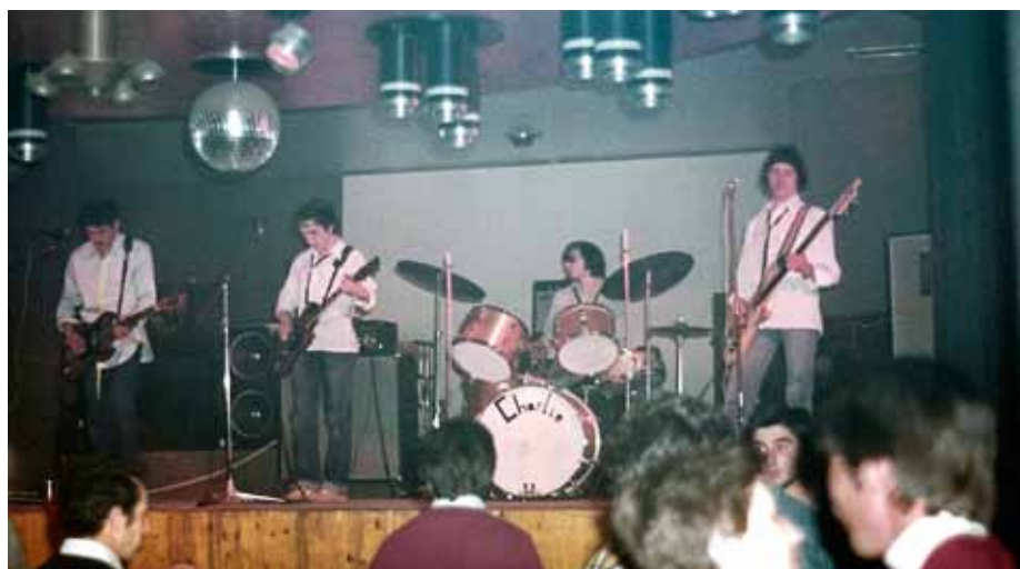
Discoteca Alcor (Alcorisa, 1979)