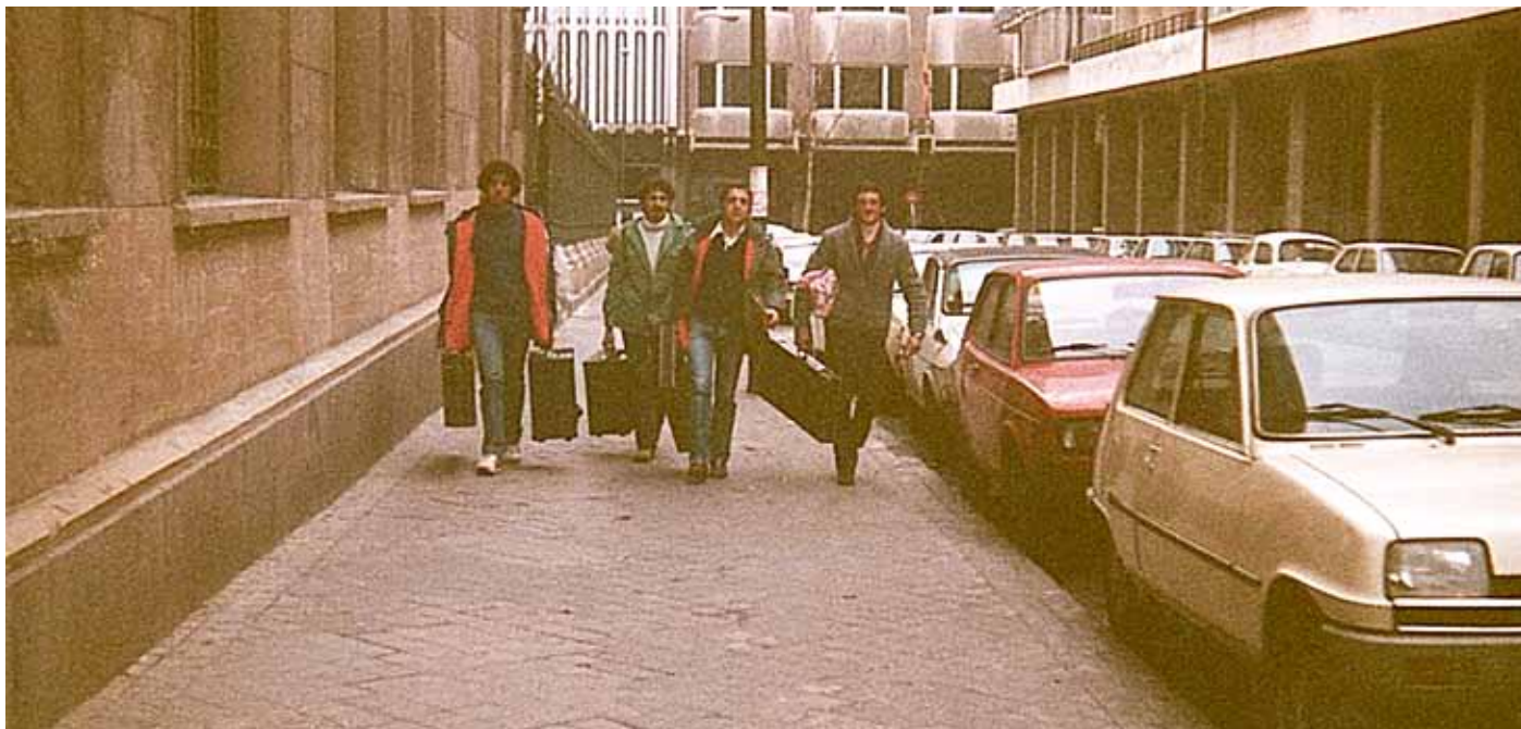
Camino al estudio de grabación en Madrid (12 de febrero, 1983, tras el encierro minero)

Con este disco se han ganado el cariño y el respeto de los seguidores de la banda, y a base de directos y apariciones en diferentes cadenas de televisión el grupo transmite una sensación de que algo bueno pueda suceder en breve.