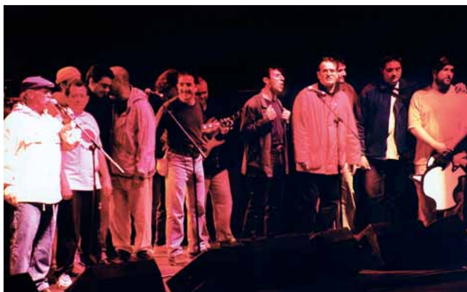
Pirineos Sur. Homenaje a Labordeta

Acolla es un grupo que siempre ha intentado estar presente y nunca ha tirado la toalla, en el peor de los casos la ha colgado, pero nunca se ha rendido y en el año 2008 el grupo se atreve con otro trabajo: A cielo abierto . Sobre este trabajo el grupo opina: "Siempre