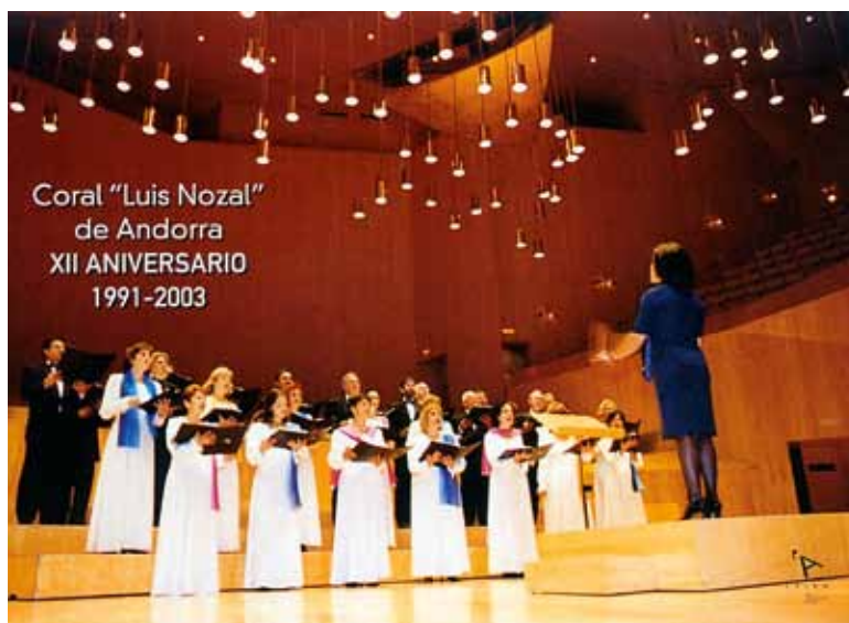
Portada del folleto y postal realizados por la coral como conmemoración de su XII aniversario.