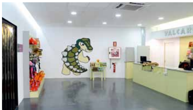
Recepción y tienda de Valcaria. Al fondo Yardank, la mascota de este nuevo centro.

Valcaria, el nuevo centro satélite de Ariño, se suma así este año al resto de centros distribuidos en distintos municipios de la provincia de Teruel que forman parte de Territorio Dinópolis, en la que será su decimoquinta temporada. En todos ellos se muestran descubrimientos científicos de relevancia internacional y se presentan los restos paleontológicos hallados en yacimientos cercanos a las localidades en las que se ubican.