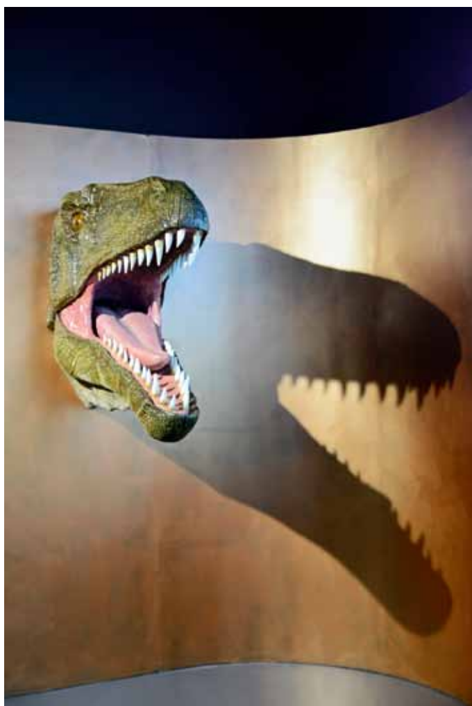
Una de las reproducciones que pueden verse en Valcaria.