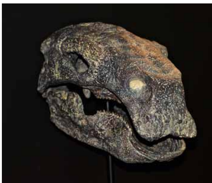
Reproducción del Proa valdearinnoensis , el dinosaurio hallado en Ariño.

Valcaria, el nuevo centro satélite de Ariño, se suma así este año al resto de centros distribuidos en distintos municipios de la provincia de Teruel que forman parte de Territorio Dinópolis, en la que será su decimoquinta temporada. En todos ellos se muestran descubrimientos científicos de relevancia internacional y se presentan los restos paleontológicos hallados en yacimientos cercanos a las localidades en las que se ubican.