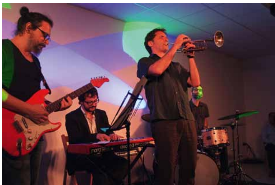
El cuarteto Trakas durante su actuación en el sótano del museo.

Como no puede ser de otra manera en un pueblo que destaca por su siempre magnífica acogida a todos sus visitantes la intensa tarde terminó con la degustación de las viandas preparadas por las mujeres de Crivillén.