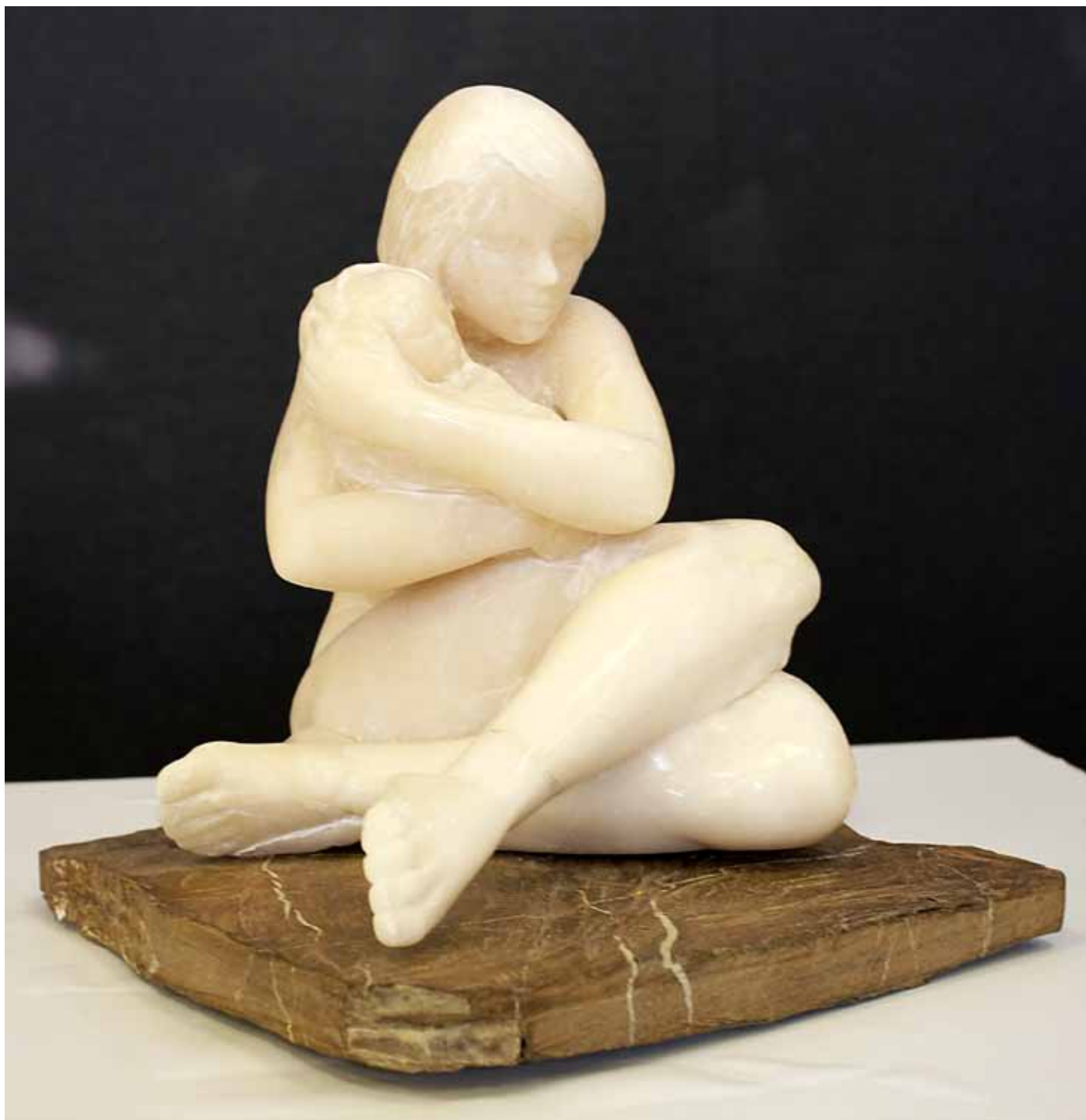
Maternidad, primer premio de la categoría escultura, obra de Luis Pascual Ferrer.

como públicas- no lo tuvo nada fácil, pues en esta tercera edición ha habido un considerable aumento tanto en el número como en la calidad de las obras presentadas. Finalmente, y por unanimidad, fueron seleccionados 33 artistas (22 pintores y 11 escultores). La creatividad personal, la originalidad temática, la correcta ejecución técnica y el resultado plástico fueron los valores que se tuvieron en cuenta para realizar la selección. Cabe destacar la variedad de las propuestas presentadas, que han dado lugar a una magnífica exposición que gustó mucho a los asistentes.