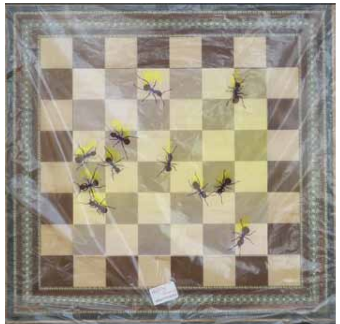
Hormigas jugando al ajedrez. Fotografía de Julio Sánchez para el cartel de su última exposición, titulada Diversidad (Real Sociedad Fotográfica de Zaragoza del 5 al 21 de noviembre 2013).

Creativo siempre, con todo, pero ya te digo que no han salido muchas a la luz. Tengo cajas llenas con sobreimpresiones, reservas, líneas, fotografías sobre soporte analó-