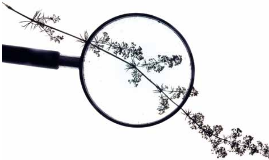
Botánica. Fotografía de Julio Sánchez, 2013.

mos en el Festival de Cine de Huesca. Todo esto Alberto mucho más que yo.