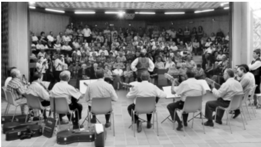
Agrupación Laudística de Andorra.