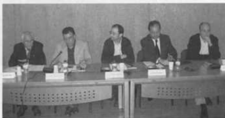
Componentes de la mesa que presentó la guía de Rutas-CAI sobre la comarca de Andorra-Sierra de Arcos.

de la zona, que actualmente está recibiendo un fuerte impulso en su preservación. Ya desde la portada del libro destaca la fiesta de «La Encamisada», posteriormente explicada en una ventana temática, pasando después por diversas romerías a la ermita de San Pedro en Oliete, a la Virgen de Arcos en Ariño, o las de Crivillén, Ejulve, Gargallo y