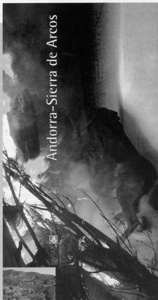
Portada de la guía