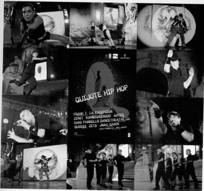
Composición de imágenes sacadas del espectáculo Quijote Hip Hop ofrecido en la escalinata de la Biblioteca Nacional de Madrid.

copia que incluía una selección muy amplia (de unos 45 minutos) de la representación completa (unos 75 minutos).