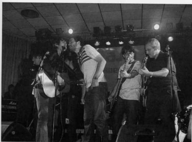
Mezcla de grupos en el fin del festival