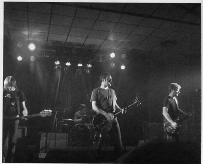
La Habitación Roja

liana sonaron apabullantes, como nos tienen acostumbrados en sus últimas actuaciones, y en su repertorio recuperaron hasta temas antiguos como Mi habitación , lo que se agradece bastante. La sala ya se había convertido en una pista de baile entregada a la música de Jorge, Pau y compañía.