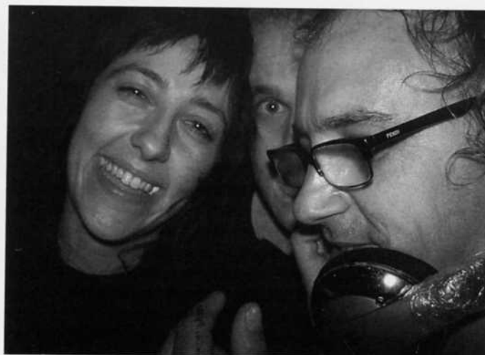
Fiesta final de Djs