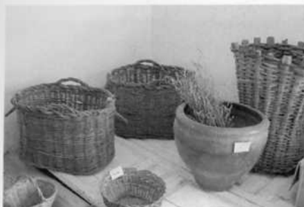
Algunas muestras de piezas etnográficas expuestas por los vecinos en los "rincones".