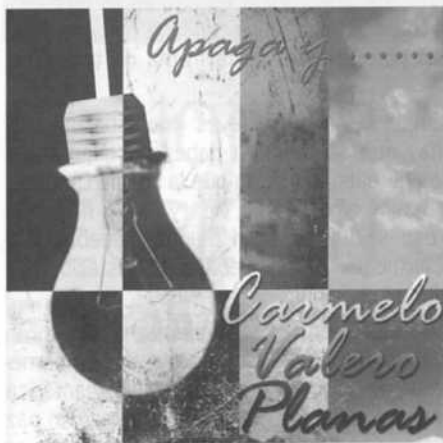
Portada del disco de Carmelo Valero.