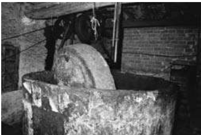
Molino de la vieja almazara.