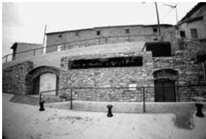
Acceso al Centro de interpretación del fuego y la fiesta.