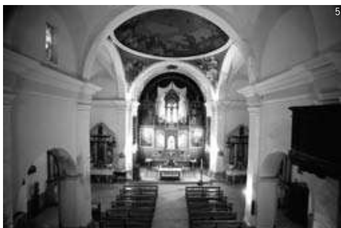
4- Detalle urbanístico 5- Interior de la Iglesia de Santo Toribio. 6- Calvario.