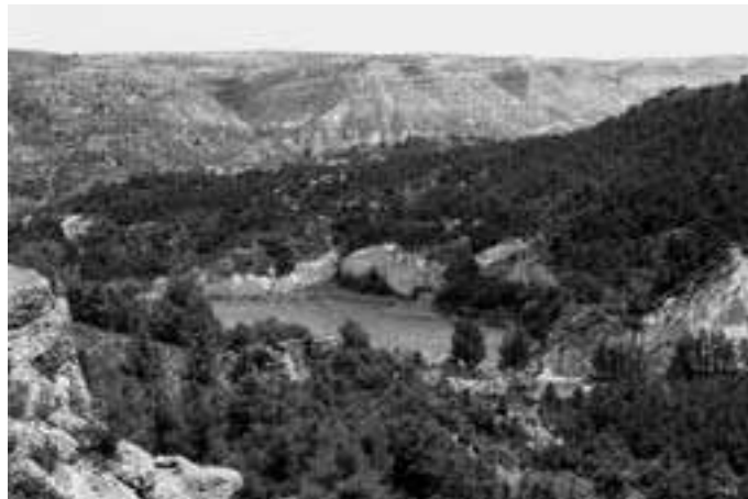
Paisaje visto desde el Moncoscol.

Hablar, pues, de pueblos como Estercuel es contar un pasado más o menos esplendoroso, un presente difícil y, desde luego, un futuro incierto, a pesar de los esfuerzos tenaces y generosos por revitalizarlos. Por eso, entre las dos miradas de las que hablábamos antes, ambas imprescindibles, tienen que trabajar el Estercuel del futuro con sus proyectos respectivos buscando dar nuevo impulso a un lugar lleno de bellezas naturales que hay que mantener, pero también buscando medios de vida que sean atractivos para sus habitantes. ■