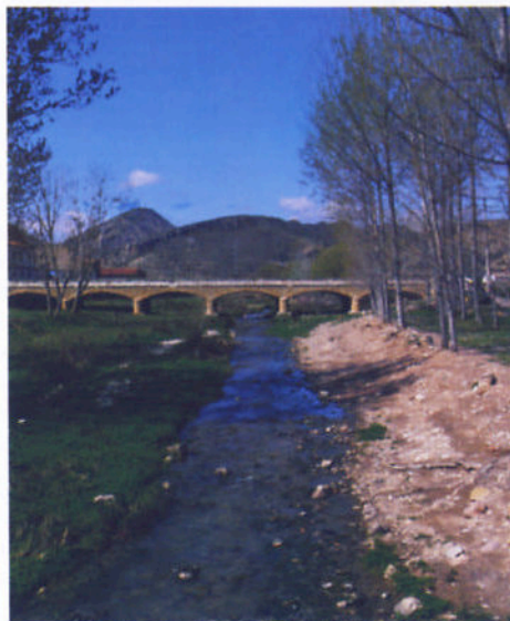
El río Martín a su paso por Oliete

El río Martín es el río de mayor caudal y el más conocido porque es uno de los principales afluentes del Ebro en su margen derecha y por