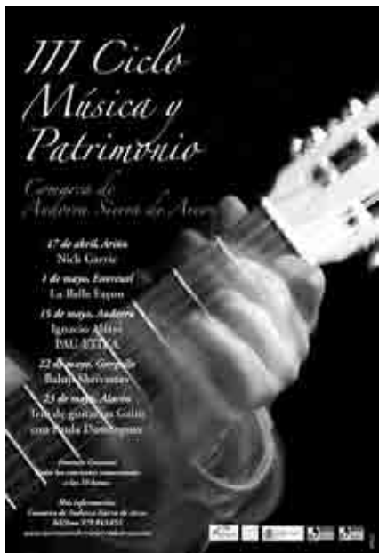
Cartel del III Ciclo Música y Patrimonio.