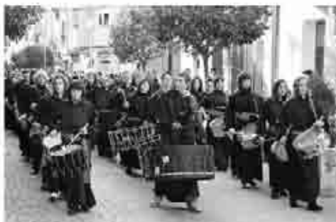
Procesiones de Semana Santa.

tura Pública Contemporánea y experta en la organización de eventos de creatividad social y colectiva fue la conductora de los talleres desarrollados en el mes de abril, relacionando arte contemporáneo, creatividad social y naturaleza.