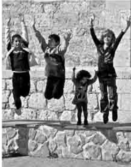
Fotografía de la exposición del Calendario 2011.

Se presentó en Ariño el calendario 2011 editado por la Comarca, con fotografías de los niños de la comarca, el futuro de la misma, del Grupo Lumière,