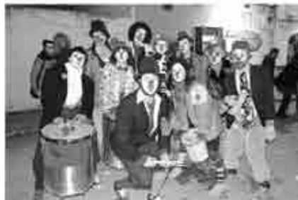
Celebración del carnaval en Andorra.