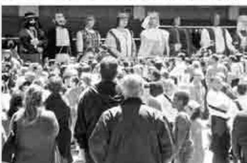
Cartel del XI Encuentro de Gigantes de Aragón, realizado en el CEE Gloria Fuertes de Andorra y desfile de los Gigantes de Aragón en Andorra.