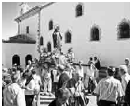
Procesión de San Macario en Andorra.

La procesión de San Macario fue el acto central de las fiestas de Andorra. Los danzantes y las gitanillas acompañaron la procesión con sus bailes hasta la iglesia, donde se celebró la santa misa.