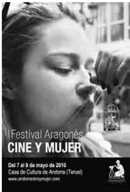
Cartel del I Festival Aragonés Cine y Mujer.

sobre Las actrices del siglo XXI y se proyectó Ese instante , de David Villaraco y Chus de Castro (Fundación First Team).