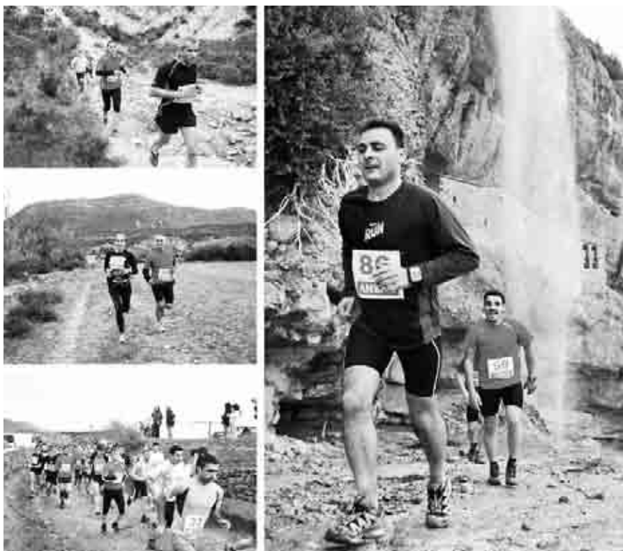
Participación del Kolectivo Vertical en la III Osan Cross Mountain.

El Taller de reciclaje y decoración con elementos naturales, dentro del programa “Barbecho”, reunió a personas interesadas en desarrollar habilidades creativas en pro de la mejora y conservación del medio natural cercano a Andorra.