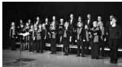
Concierto de Navidad de la Coral Luis Nozal en Andorra.

La Coral Luis Nozal reunió en torno al concierto de Navidad a numeroso público, en el nuevo espacio escénico