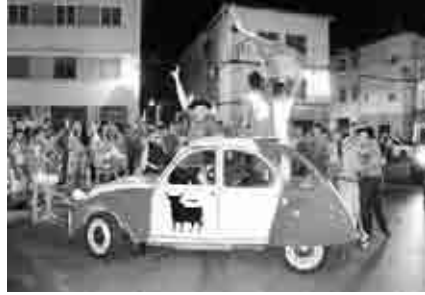
Celebración en las calles de Andorra del triunfo en el campeonato del mundo de fútbol.

La celebración de la victoria de la selección española de fútbol en el campeonato del mundo en Sudáfrica ocupó las calles de Andorra.