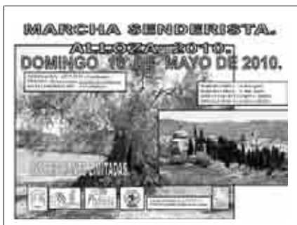
Cartel de la Marcha Senderista en Alloza.

Comenzó la Semana Cultural de Alloza con una marcha senderista que, con dos recorridos, pasó por Las Ramblas, Planipilas, Barranco Costea, Río Escuriza hasta la caseta del pantano, Fuente Amores, el Corral de la Roya y Matacabra. Al final, una comida colectiva permitió intercambiar experiencias.