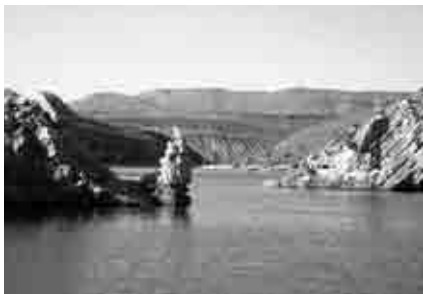
Visita guiada al embalse de Cueva Foradada.

segunda ruta organizada por Turismo de la Comarca, que se repitió los miércoles 4, 11 y 18 de agosto.