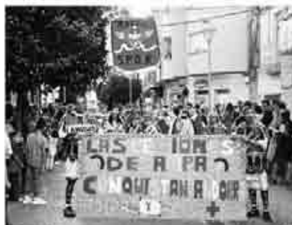
Banda de música y desfile de carrozas en las Fiestas de Andorra.