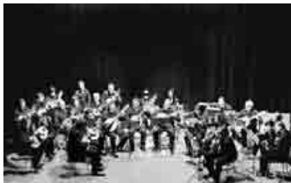
Concierto de Navidad del Grupo Laudístico y Ensamble de Laúdes de la Escuela de Música de Andorra.

Concentración en la Plaza del Regallo para protestar por la intervención del gobierno de Marruecos sobre el campamento saharauí Gdaim Izik y mostrar la solidaridad con el pueblo saharauí.