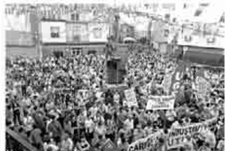
Manifestación en Andorra bajo el lema "Por un futuro digno para nuestros pueblos".