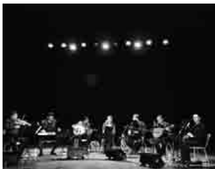
Actuación del grupo Al-Buruz en Andorra.