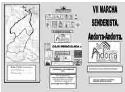
Cartel anunciador de la VII marcha senderista comarcal.

Continuando con las Jornadas de Convivencia, se recibió a las delegaciones de tamborileros en el polideportivo municipal. Posteriormente, tuvo lugar el acto de Exaltación de Tambores y Bombos a cargo de las cuadrillas de los nueve pueblos de la Ruta en el polideportivo municipal y el desfile de los grupos participantes.