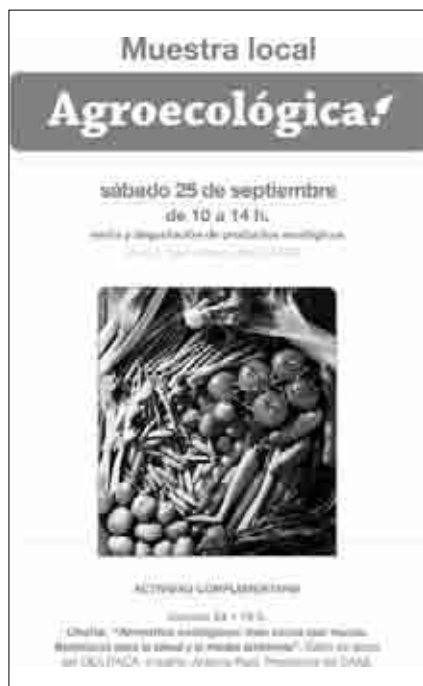
Cartel del mercado agroecológico.

Se realizó en Andorra un mercado agroecológico organizado por el CEA