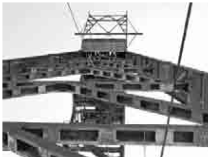
Visita guiada al Parque Minero MWINAS.

Comenzó el programa de visitas guiadas al Parque Minero de la comarca Andorra-Sierra de Arcos (MWINAS), organizado por el Departamento de Cultura y Turismo de la Comarca con la colaboración de la Asociación Cultural Pozo San Juan, dentro del plan de dinamización cul-