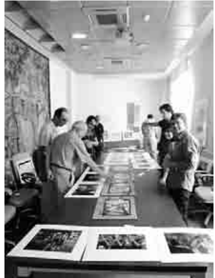
Deliberación del jurado calificador del IX Certamen Internacional de Fotografía “Villa de Andorra”.