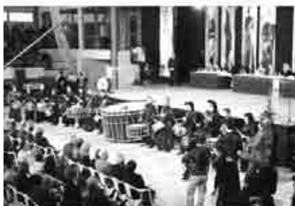
Distintos momentos de las Jornadas de Convivencia de la Ruta del Tambor y Bombo.

tentes de los pueblos de la Ruta del Tambor y Bombo. En la Plaza del Regallo se inició la tamborrada y a las cinco de la mañana el fin de redobles, también en la Plaza del Regallo, se acompañó de “quemadillo y pastas tradicionales”.