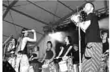
Actuación de Toporsao en Andorra.

Toporsao, Amenazha, Bolintxe y sus Compintxes.