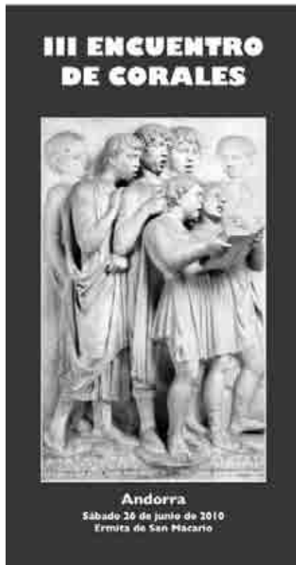
Cartel del tercer Encuentro de Corales Villa de Andorra.

La Casa de Andalucía celebró su XXIV romería desfilando por las calles de Andorra y en procesión con la Virgen del Rocío hasta San Macario.