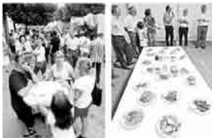
Animación en torno a la Feria de la Tapa en Andorra.

En la avenida San Jorge de Andorra comenzó la primera Feria de la Tapa, organizada por la Asociación Agroalimentaria del Bajo Martín-Sierra de Arcos y cofinanciada por ADIBAMA con cargo al Programa Leader. Elaboradas con productos de la tierra y con la colaboración de diferentes restaurantes con productores agroalimentarios de nuestro entorno, cumplió la finalidad de divulgar el patrimonio gastronómico, auténtico recurso cultural y turístico para nuestras comarcas. Incluyó charlas, conferencias, catas de productos, etc.