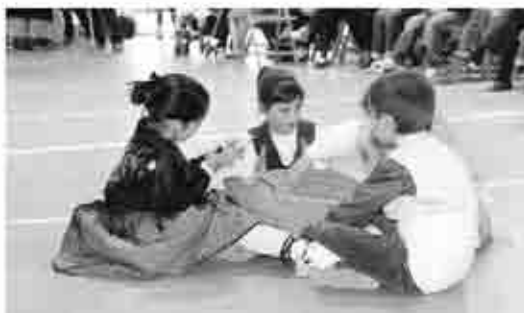
Distintos momentos de La Contornada en Crivillén.