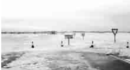
Carretera cortada por la gran nevada de enero.

Cayó una buena nevada, que unida a las bajas temperaturas hizo que muchos pueblos de la comarca permanecieran casi aislados hasta el día 13. Ejulve y Gargallo fueron los municipios más afectados.