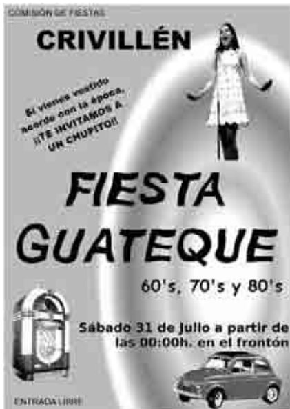
Cartel anunciador del guateque en Crivillén.

Se inauguró en el Centro de Arte Contemporáneo Pablo Serrano de Crivillén,