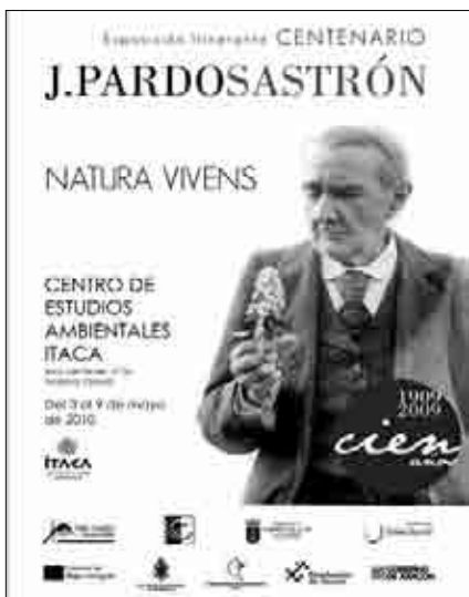
Cartel de la exposición Natura vivens , anunciador de las actividades en torno a Pardo Sastrón.

La charla y el taller Las plantas de Pardo Sastrón fue la actividad que acompañó la inauguración de la exposición Natura vivens sobre la vida y obra del botánico turolense, en el CEA Itaca.