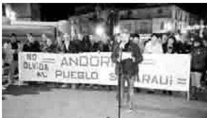
Concentración en la Plaza del Regallo, en solidaridad con el pueblo saharauí.