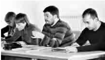
Asamblea del colectivo "Nuestros montes no se olvidan".

En la iglesia Nuestra Señora de la Natividad de Andorra, se celebró un concierto de música sacra, a cargo del Coro Unión Musical Nuestra Señora de los Pueyos de Alcañiz y de la Coral Luis Nozal de Andorra, bajo la dirección de Beatriz Barceló Colomer. Se interpretaron obras de Palestrina, Morales, Tomás Luis de Victoria, Skraup, Liszt, Bruckner, Frank y Zangl. Las corales estuvieron acompañadas por piano, violonchelo, trompa y violín.