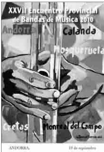
Cartel del XXVII Encuentro Provincial de Bandas de Música celebrado en Andorra.

terminar el pasacalle, se realizó el concierto y posteriormente la cena.