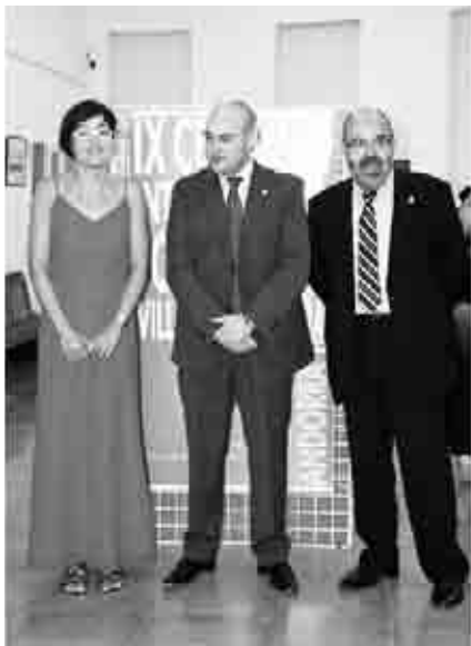
Inauguración de la exposición fotográfica IX Certamen Internacional de Fotografía "Villa de Andorra".