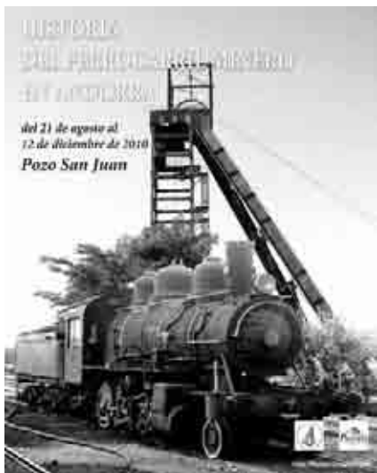
Cartel de la exposición fotográfica Historia del ferrocarril minero en Andorra .

recoge la historia del ferrocarril minero en Andorra desde el año 1953 hasta los primeros 90.