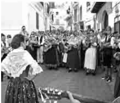
Ronda del Cachirulo José Iranzo.

Actuación de Toporsao en Oliete dentro del programa de actuaciones Campaña Cultural Comarcal 2010.