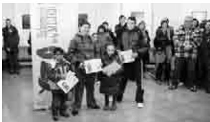
Premiados en el concurso de fotografía infantil y juvenil "Comarca en igualdad".

Se inauguró la exposición Comarca en igualdad , dedicada a la mujer y el deporte, que recogía momentos destacados de la trayectoria deportiva de algunas mujeres de la comarca, en la Sala de la Estación de Andorra, dentro de las actividades organizadas por la Consejería de Bienestar Social de la Comarca Andorra-Sierra de Arcos y la Concejalía de la Mujer del Ayuntamiento de Andorra en colaboración con el Instituto Aragonés de la Mujer. El primer concurso de Fotografía Infantil y Juvenil fue una de las muchas actividades realizadas en torno al Día de la Mujer. Posteriormente, la exposición pasó a Crivillén y Alloza.