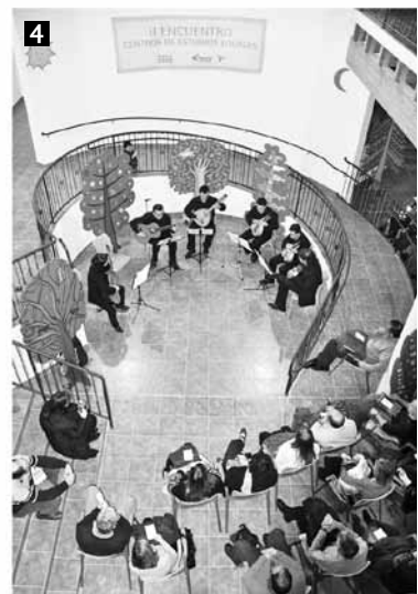
1. Pedro Rújula presenta a Miquel Marín. (Foto Rosa Pérez). 2. Mesa de debate en el Encuentro de Centros de Estudios. (Foto Rosa Pérez). 3. Cartel del II Encuentro de Centros de Estudios, en Andorra. 4. Actuación del grupo musical Ensemble . (Foto Rosa Pérez)