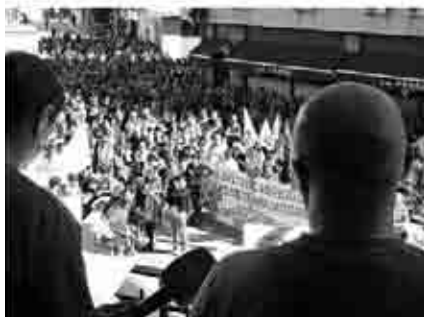
Concentración en la Plaza del Regallo el día de la huelga general.

Ítaca, el Comité Aragonés de Agricultura Ecológica, CERAI, UAGA y los grupos Leader de las comarcas Bajo Martín-Andorra-Sierra de Arcos y Bajo Aragón. En la avenida de San Jorge se pudieron comprar distintos productos y conocer la variedad ecológica de los productores aragoneses.