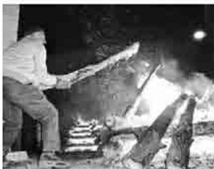
Instantáneas de la Encamisada de Estercuel.

eligiendo la aliaga más grande y la hoguera mejor formada, valorando estructura, composición y combustible. El museo permaneció abierto en una fiesta que justifica la creación del mismo, ya que gira en torno al fuego.