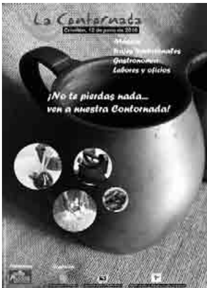
Cartel de La Contornada.