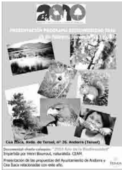
Cartel anunciador de las actividades 2010, año de la Biodiversidad.

En su intervención final, el alcalde agradeció a ambas el que hubieran pensado en Andorra para celebrar este encuentro y recordó el trabajo en pro de la cultura y su esfuerzo para que no sea la pagana en tiempos de crisis.