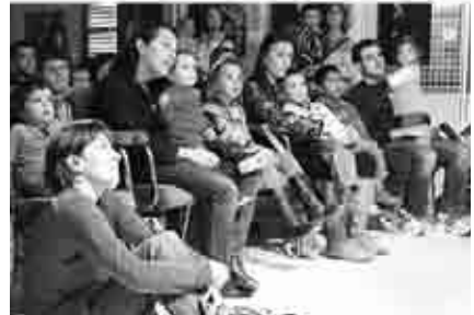
Actividad de animación en el Día de las Bibliotecas, celebrado en Estercuel.