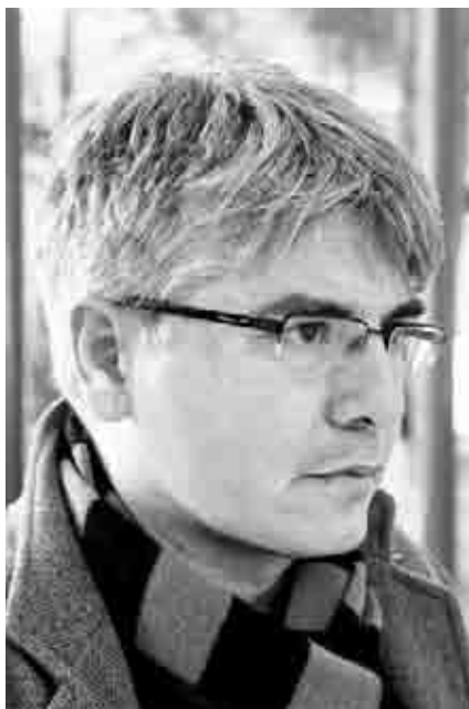
Juan Bonilla, en el IES Pablo Serrano, dentro del programa “Invitación a la lectura”.

El escritor Juan Bonilla, participante en el programa “Invitación a la lectura” de la DGA, visitó el IES Pablo Serrano, donde mantuvo un coloquio sobre su obra narrativa con los estudiantes de 1.º de Bachillerato.