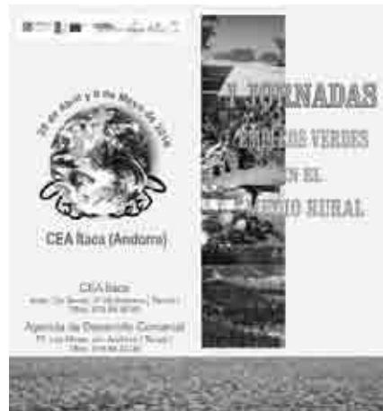
Folleto de las primeras jornadas Empleos verdes en el medio rural .

Comenzaron las primeras jornadas “Empleos verdes en el medio rural”, organizadas por ADIBAMA, el CEA Ítaca y la Agencia de Desarrollo Comarcal, destinadas a analizar las posibilidades de desarrollo sostenible en torno a este tipo de empleos en el medio rural. Cristina Monge, directora del área de Proyección Exterior de la Fundación Ecología y Desarrollo, expuso el informe del Programa de Naciones Unidas para el Medio Ambiente y analizó el papel de los empleos verdes