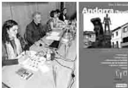
Presentación de la guía turística de Andorra.