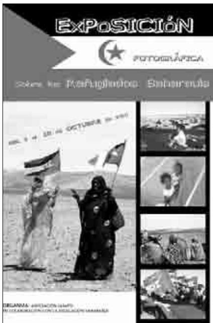
Cartel de la exposición fotográfica sobre los refugiados saharauis.

ma Vacaciones en Paz, un programa de ayuda humanitaria y de sensibilización política y social con una buena implantación en la comarca Andorra-Sierra de Arcos, con acogida de niños saharauis durante los meses de julio y agosto.