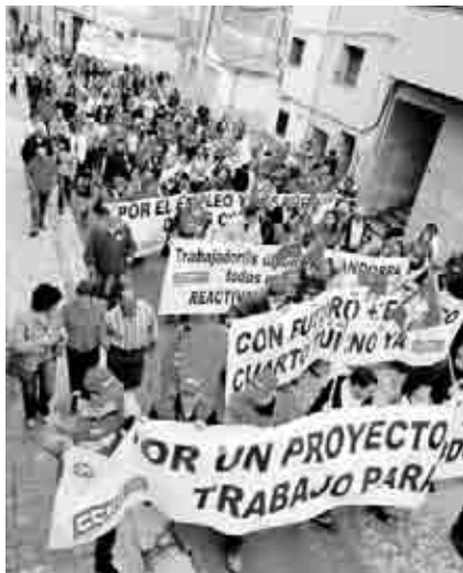
Concentración y lectura del manifiesto en la Plaza del Regallo.