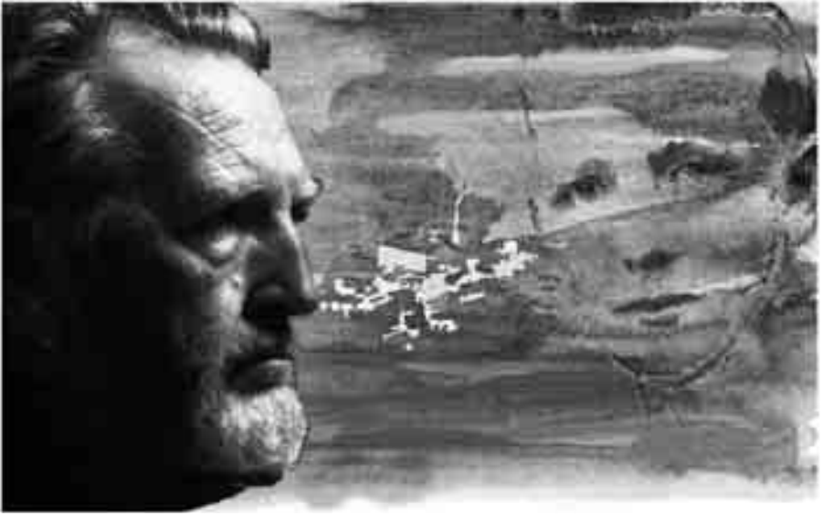
Ilustración base para el cartel de las jornadas en homenaje a Pablo Serrano en Andorra, obra de Jesús Gómez Planas.