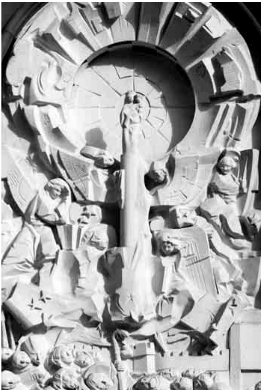
Venida de la Virgen.