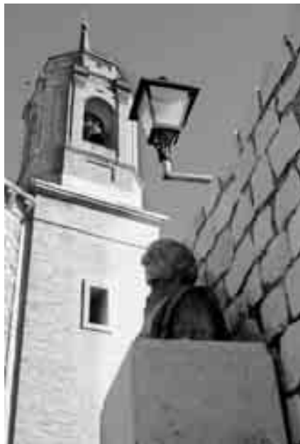
José Gervasio Artigas.