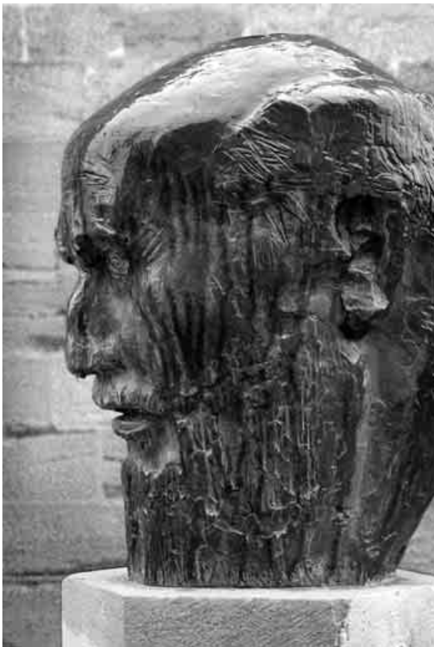
Monumento a Ramón y Cajal.