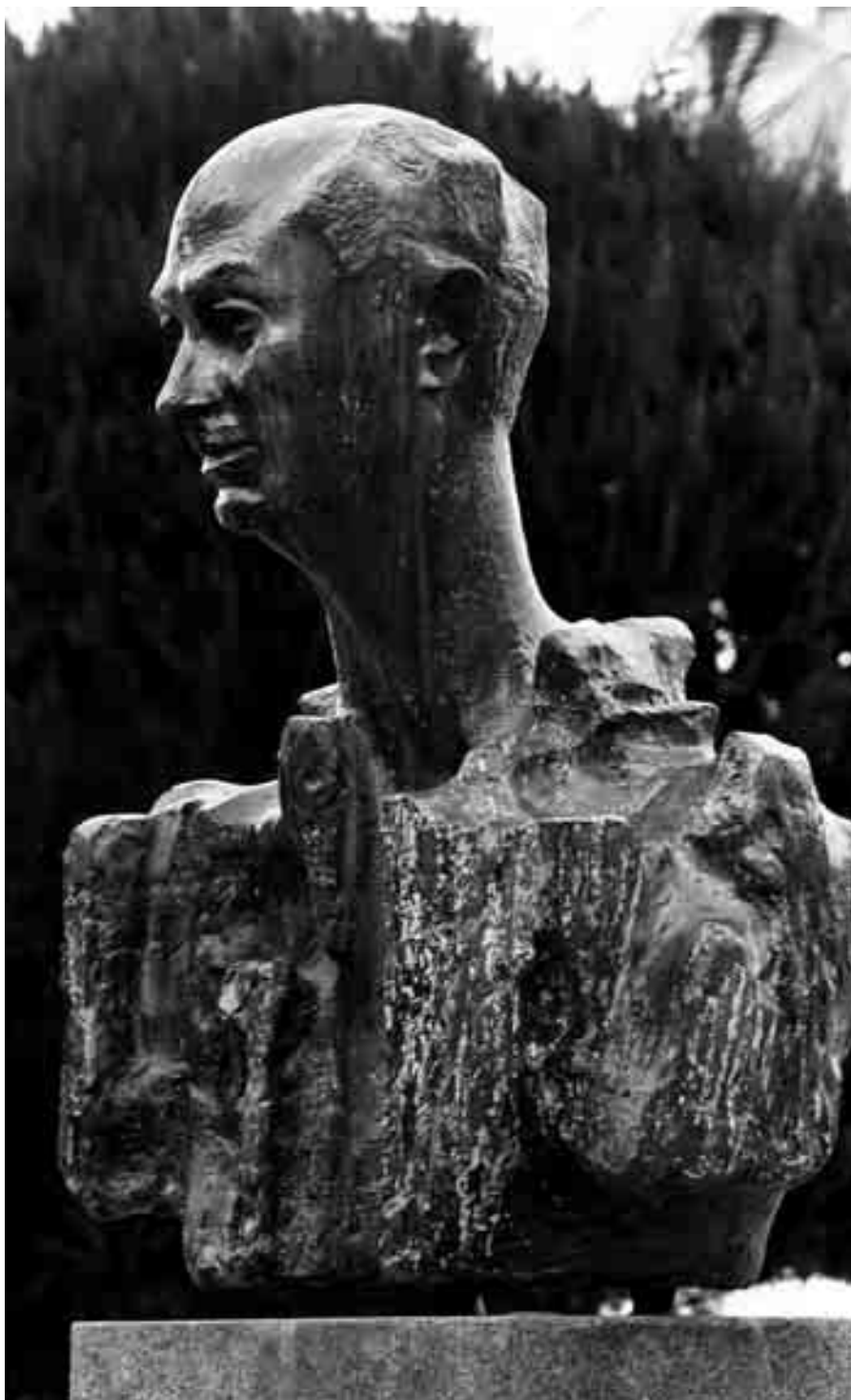
Mariano Navarro Rubio.