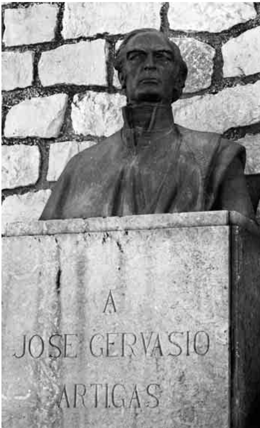
José Gervasio Artigas.