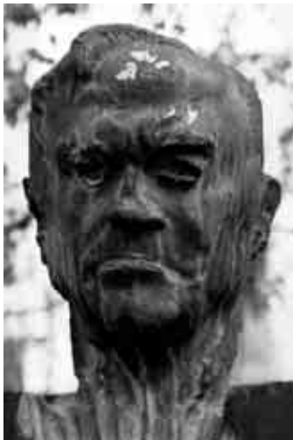
Dr. Fleming.