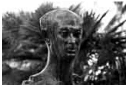
Mariano Navarro Rubio.