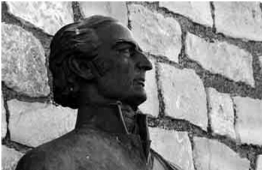
José Gervasio Artigas.

pecto a la cual el propio Serrano 1 dijo que en sus obras no era deliberada sino inherente, como consecuencia de ser aragonés.