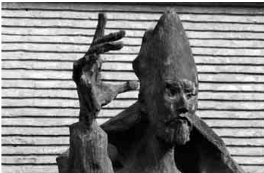
San Valero.