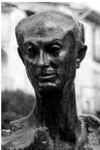
Mariano Navarro Rubio.

En julio de 1965 se instaló en Daroca (Zaragoza) el Monumento a Mariano Navarro Rubio , que fue el primer encargo aragonés a Pablo Serrano. Este monumento había sido solicitado al escultor en 1961 por la Junta Pro-Homenaje al Excmo. Sr. D. Mariano Navarro Rubio, con la mediación de José Camón Aznar, quien lo había propuesto como autor. Serrano contactó con Navarro para que posara y entregó prontamente la obra, pero la escultura, innovadora, no gustó a la mayoría de la Junta y su instalación se pospuso hasta 1965, aparentemente sin inauguración formal. La escultura y la remodelación de la plaza en que se ubica,