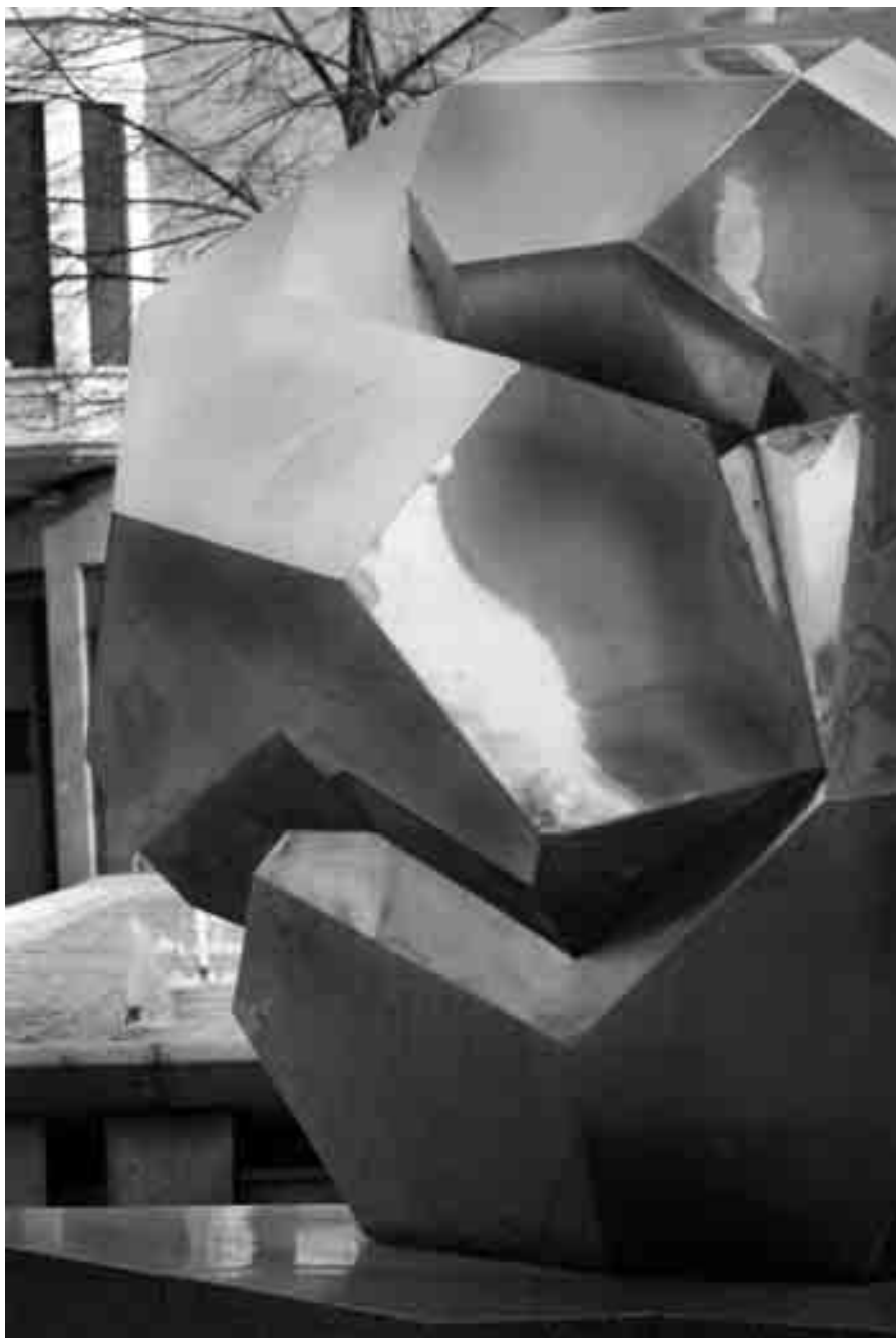
Monumento a José Sinués y Urbiola.