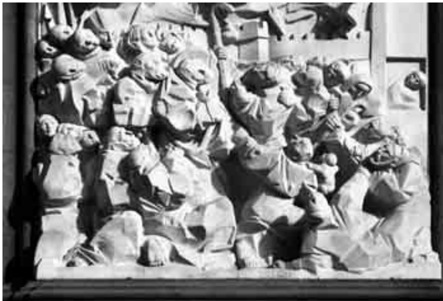
Venida de la Virgen.

leyenda: “Sir/ Alexander Fleming/ 1881-1955/ Homenaje de la ciudad de/ Alcañiz”. El tronco no tiene tan apenas desarrollo y se limita a un bloque casi geométrico, en el que únicamente se diferencia el cuello. La cabeza representa a un hombre maduro, con una postura casi frontal, pero con unos rasgos ligeramente asimétricos, especialmente visibles en las entradas del cabello, más pronunciadas a su izquierda, en la nariz y en la boca con unos labios cerrados firmemente, que, junto a unos pómulos contundentes, le dan una expresión de fuerza, mientras la mirada, con pupilas cóncavas, dirigida hacia la lejanía, indica su condición de adelantado. En efecto, la importancia de Sir Alexander Fleming (Darvel, Reino Unido, 1881-Londres, 1955) se debe a que en 1928 descubrió la penicilina, una sustancia antibacteriana que disminuyó enormemente la mortalidad infecciosa, por lo que recibió el Premio Nobel en 1945. Este monumento tiene relación con el de Daroca, pero es más simple y convencional, lo que puede deberse a limitacio-