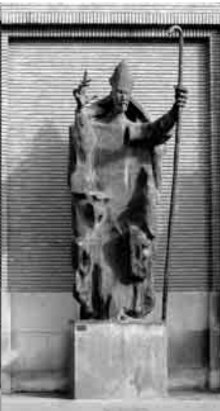
El ángel custodio de la ciudad y San Valero.