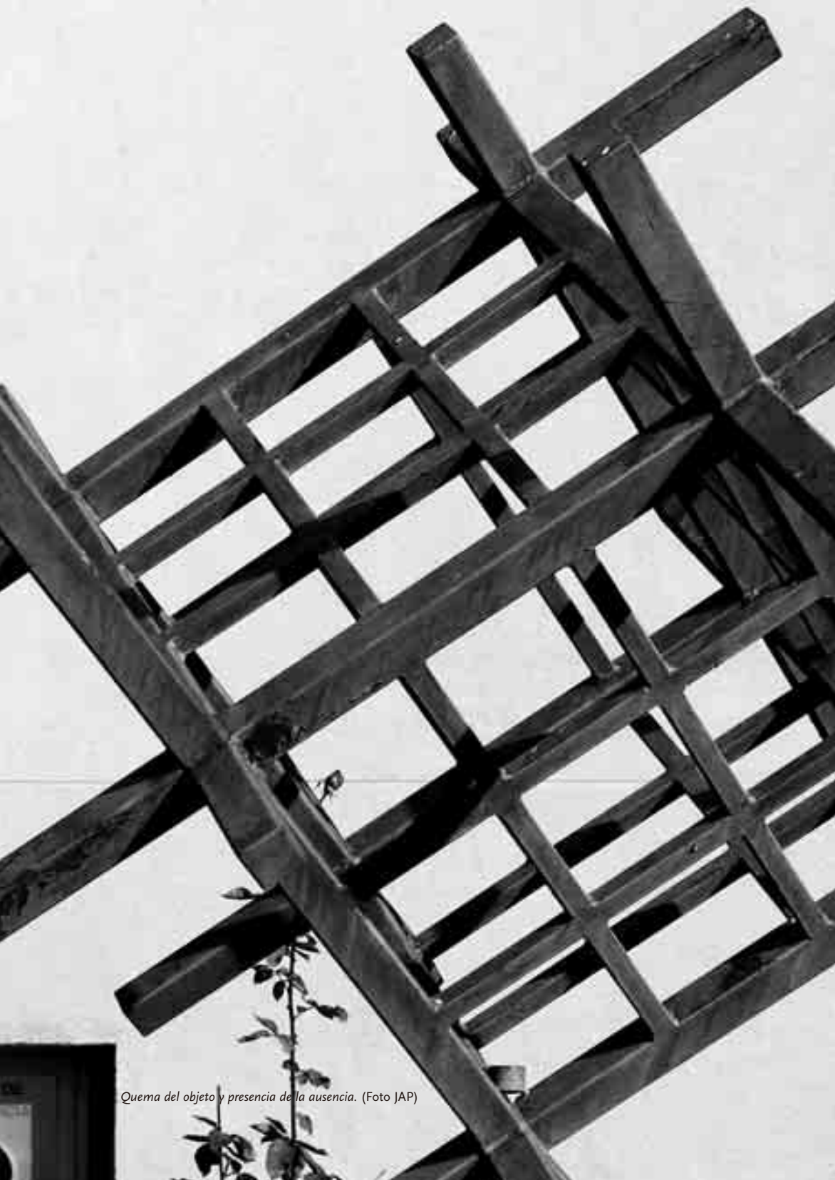
Quema del objeto y presencia de la ausencia.