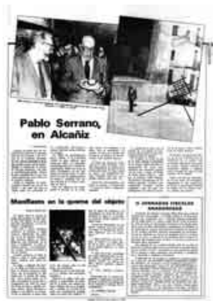
Quema del objeto y presencia de la ausencia.

vivir, convivir y sobrevivir en el marco de la cultura, el diálogo y la libertad. No era la primera vez que se realizaba la “Quema del objeto”, ya que Serrano había iniciado una serie bajo este título en 1957, pero sí la primera vez que tenía un espacio urbano abarrotado como marco. La quema es un acto conceptual, que sitúa la escultura en el espacio y en el tiempo y que produce la reflexión filosófica sobre “la presencia de la ausencia”; en ocasiones ha sido calificado de happening , pero se diferencia de éste en que sirve para construir un nuevo elemento artístico y en que integra a los espectadores, que son partícipes de la experiencia. Además de la quema se celebraron otras actividades, todas englobadas en “El pan necesario”, integrando tradición y cultura y recalcando los aspectos humanísticos, cuya importancia de nuevo reiteró Serrano 17 en su discurso de adopción. La relación entre la quema y el pan la explicó posteriormente 18 : hay una relación entre el interior del objeto, que evidencia la quema, y el espacio interior del hombre,