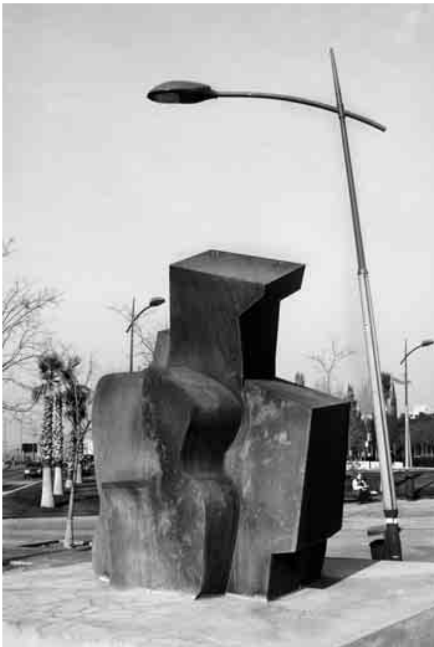
Guitarra n.º 3.